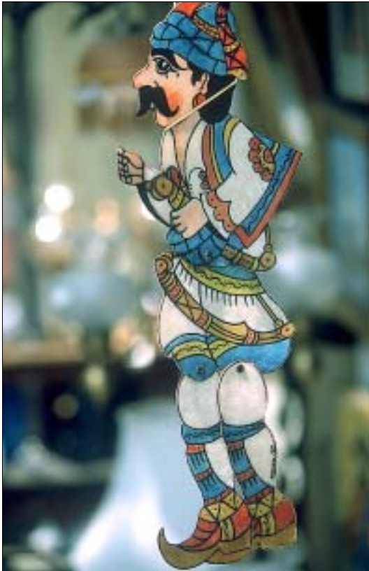
Karageosi-Figur am Flohmarkt

Fenstern. Preise für das DZ je nach Saison 94–115 €. ☎ 210-3237816-8, § 210-3237819, www.panhotel.gr .