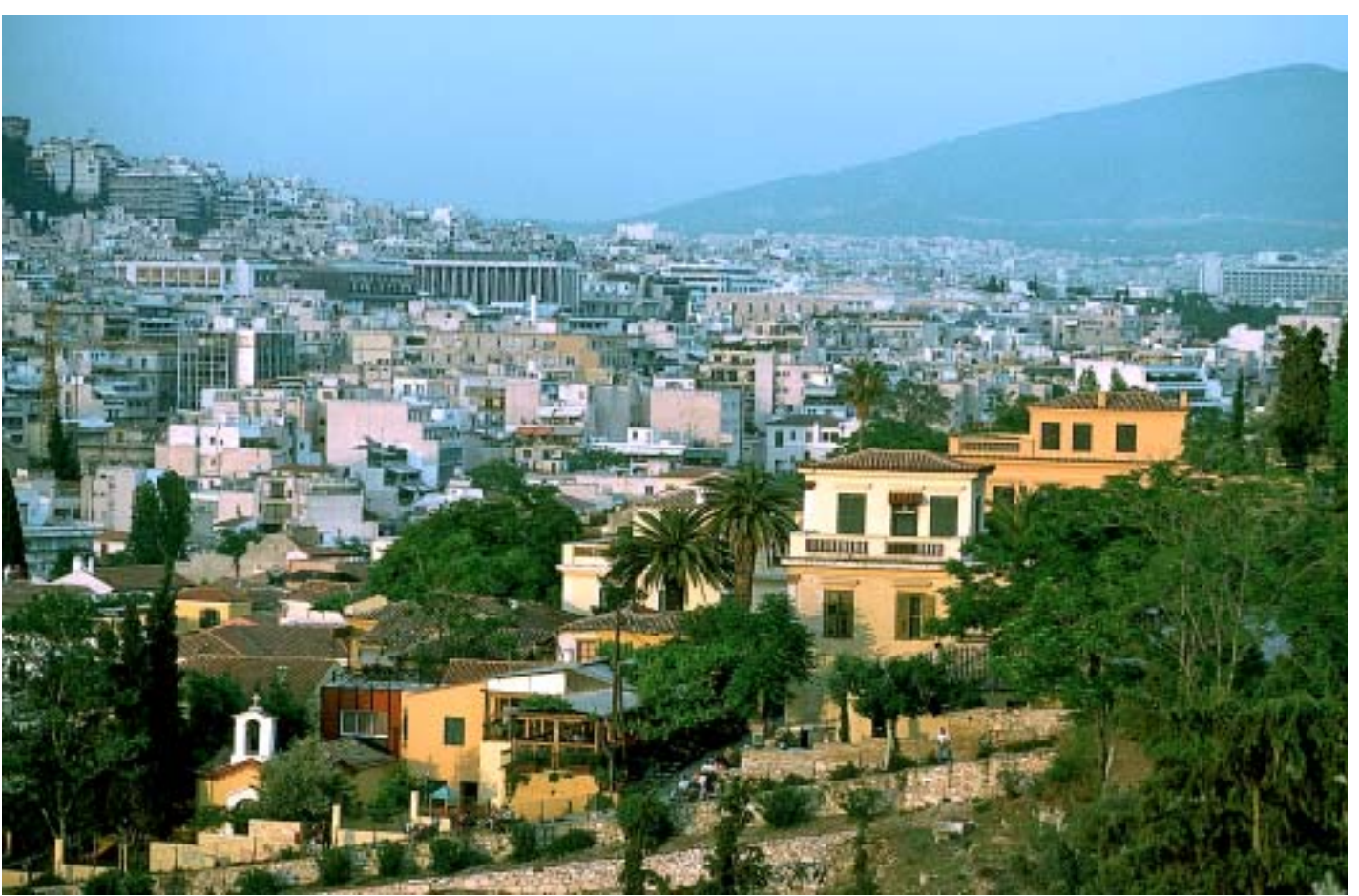
Oase in der Großstadt – die Pláka