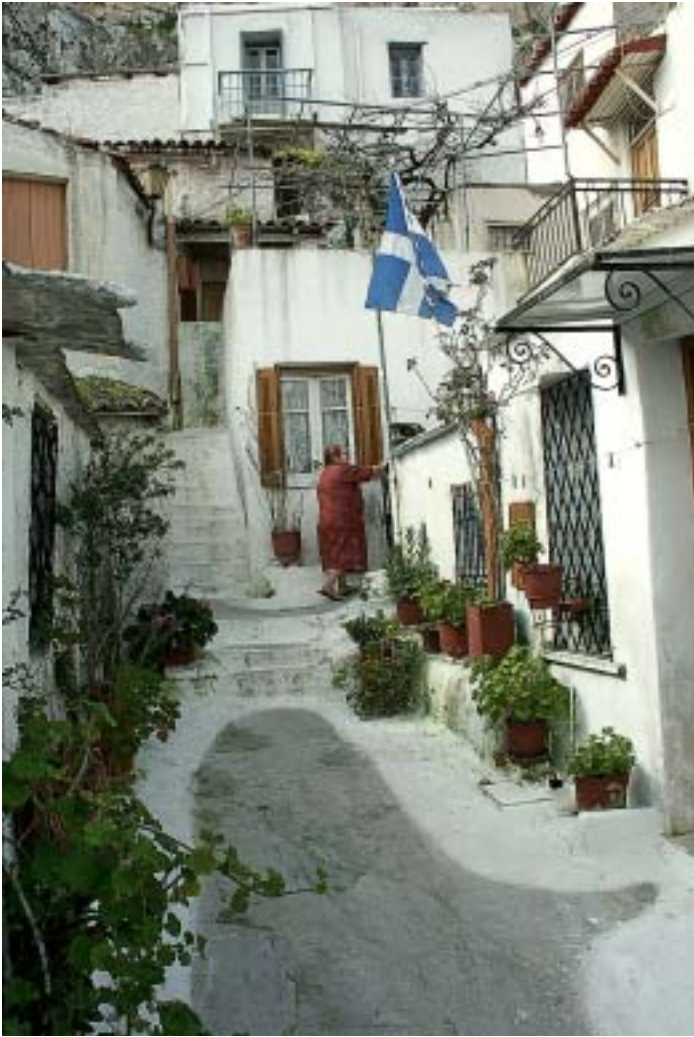
Dorfleben im Herzen der Millionenmetropole – Anafiótika

Anafiótika: Direkt unter dem Steilhang zur Akropolis liegt das romantischste Pláka-Viertel Anafiótika. Mit seinen schmalen, ruhigen Gässchen, niedrigen Häuschen, üppigen Blumenkübeln und farbenfrohen Türen wirkt es wie ein griechisches Inseldorf. Errichtet wurde es im vorletzten Jahrhundert durch Handwerker von der Kykladeninsel Anáfi, die eigentlich für den Bau des Königsschlusses nach Athen geholt worden waren. Aber auch schon in der Jungsteinzeit war dieser Teil des Burghügels bewohnt, später wurde er vom Orakel in Déphi zu heiligem Boden erklärt. Während der Peloponnesischen Kriege waren die weit oben im Akropolis-Felsen liegenden Höhlen Zufluchtsorte, in denen die Athener Bevölkerung jahrelang lebte. Von diesen obersten Gassen der Pláka bietet sich ein schöner Blick auf die Millionenstadt. Wegen der Ruhe gehören die Cafés und Tavernen in Anafiótika zu den besten Tipps in der Pláka. Außerdem gibt es zahlreiche Kirchen zu besichtigen, ebenfalls teils im Kykladenstil errichtet.